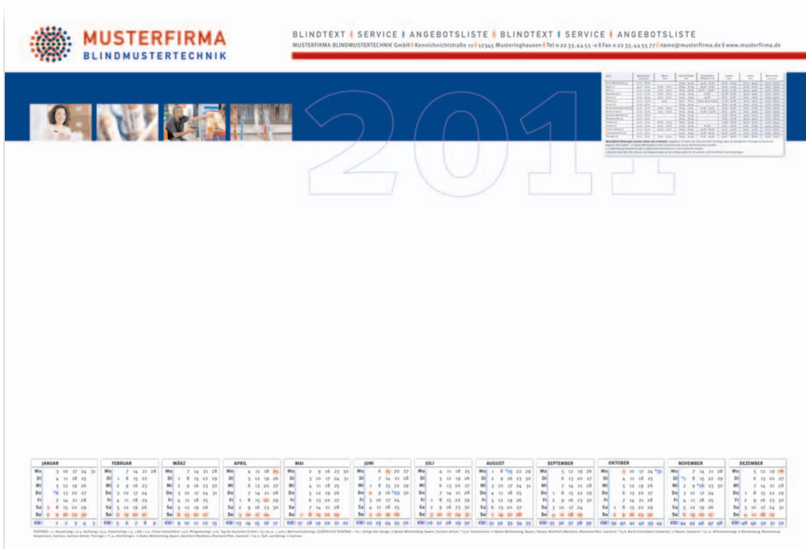
Version 4: mit Jahres-Kalender und Ferientermine (alle Bundesländer der BRD), Farbvarianten sind möglich