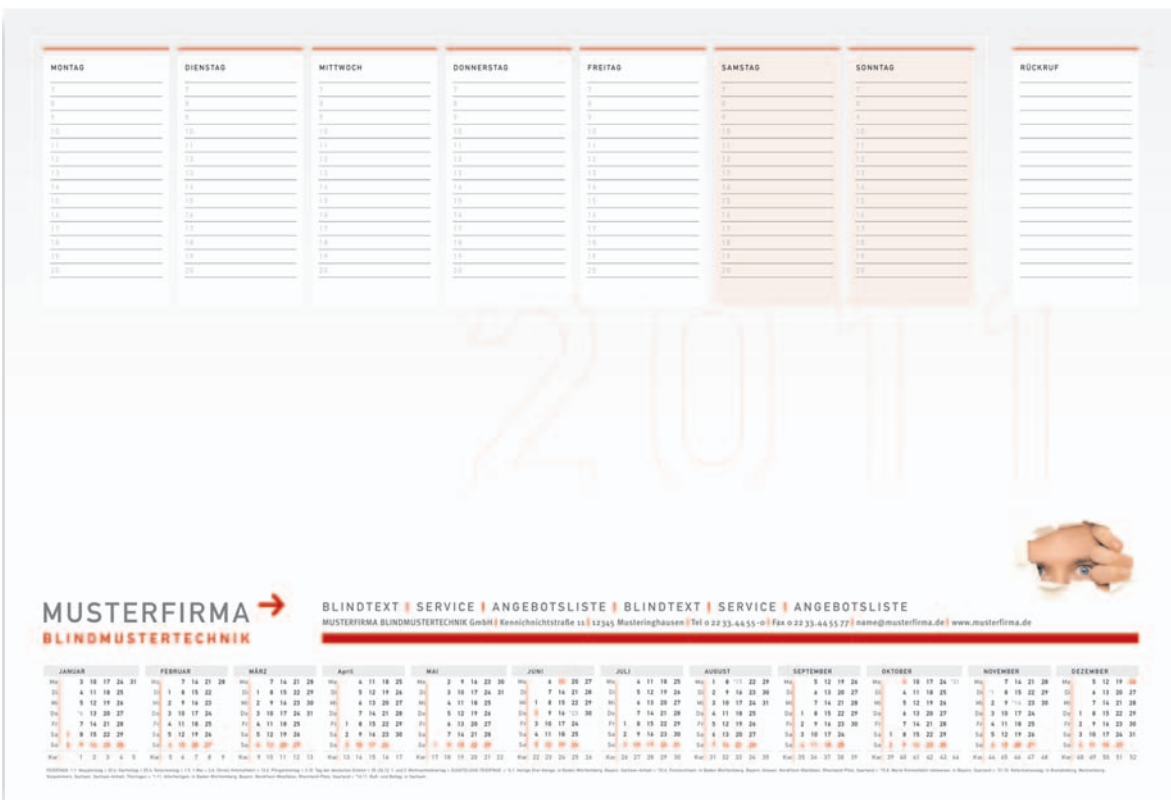
Version 6: mit Jahres-Kalender, Wochenplaner, Farbvarianten sind möglich