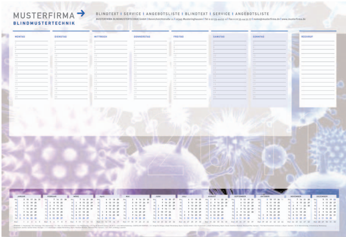
Version 9: mit Jahres-Kalender und Wochenplaner, Farbvarianten sind möglich