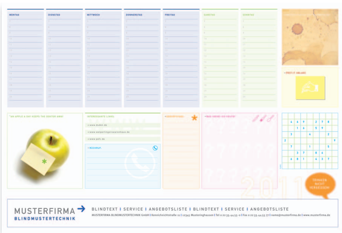
Version 10: mit Wochenplaner, Erinnerung Geburtstage + Rückrufe, div. Notizflächen, Farbvarianten sind möglich