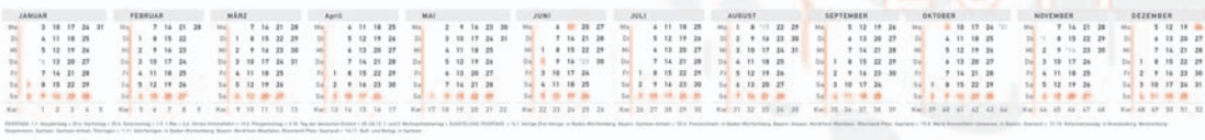
Version 2b: mit Jahres-Kalender, Bsp. Farbvariante