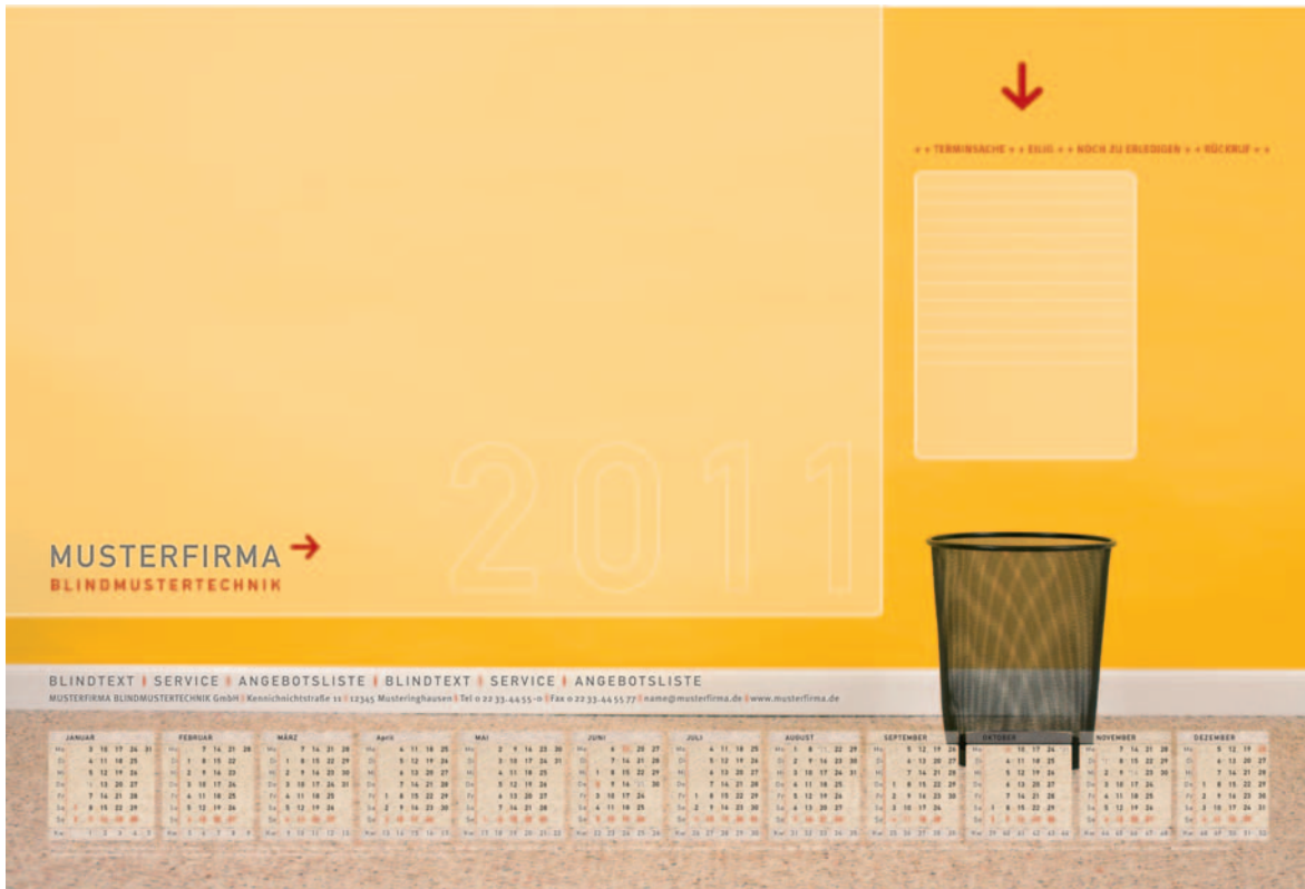
Version 5: mit Jahres-Kalender, Farbvarianten sind möglich